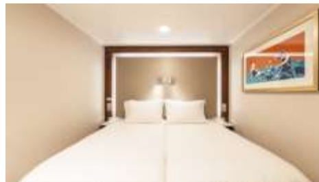
พัก 1-2 ท่าน

From 13 - 14 sq.m Max Occupancy 2-4 + Deck 5/8/9/10/11/12/13/15 2 Single Beds / 2 Single Beds + 1 Ceiling Pullman Bed / 1 Single Bed + 1 Pullman Bed + 1 Double Sofa Bed