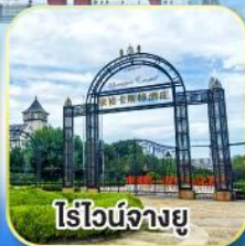
ไร่ไวน์จางยู