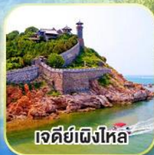
เจดีย์เฝิงโหล