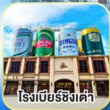
โรงเบียร์ซิงเต่า