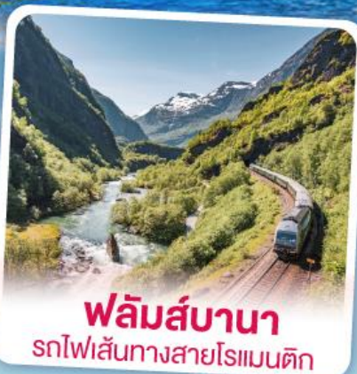
พหลิมส์บานา รถไฟเส้นทางสายโรเมนติก