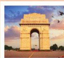
♥♥♥ India Gate