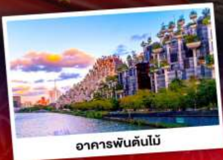
อาคารพันต้นไม้

ชมการแสดงพลุสุดปังที่สวนสนุกดิสนีย์แลนด์