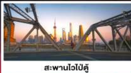
สะพานไวปู้ตู่