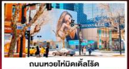
ถนนหยอไห่มีดเคิลโรด