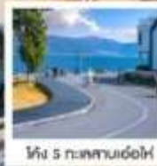
ทะเลสาบ 5 กม. ด้าหลี่