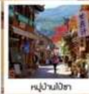
หุ่ยวานปลาซ่า