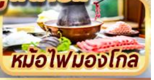
หม้อไฟมองโกเลีย