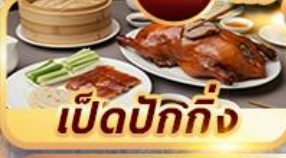
เป็ดปักกิ่ง