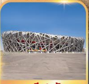
สนามกีฬารังนก