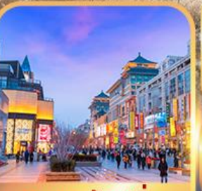
ถนนหวงฟู่จิ่ง