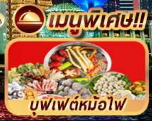
เมนูพิเศษ!! บุฟเฟ่ต์หม้อไฟ