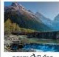
อุทยานป่าเผิงโกว