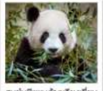
ศูนย์หมีแพนด้าจู่เจียงเยียน