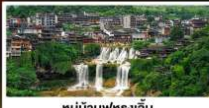
หมู่บ้านฟุทงเจิน