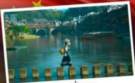
หมู่บ้านเฟิ่งทง

สุดคุ้ม!! พัก 5 ดาว ทุกคืน มนตร์เสน่ห์เมืองเก่า ริมสาងน้ำแจ่มใสแดน