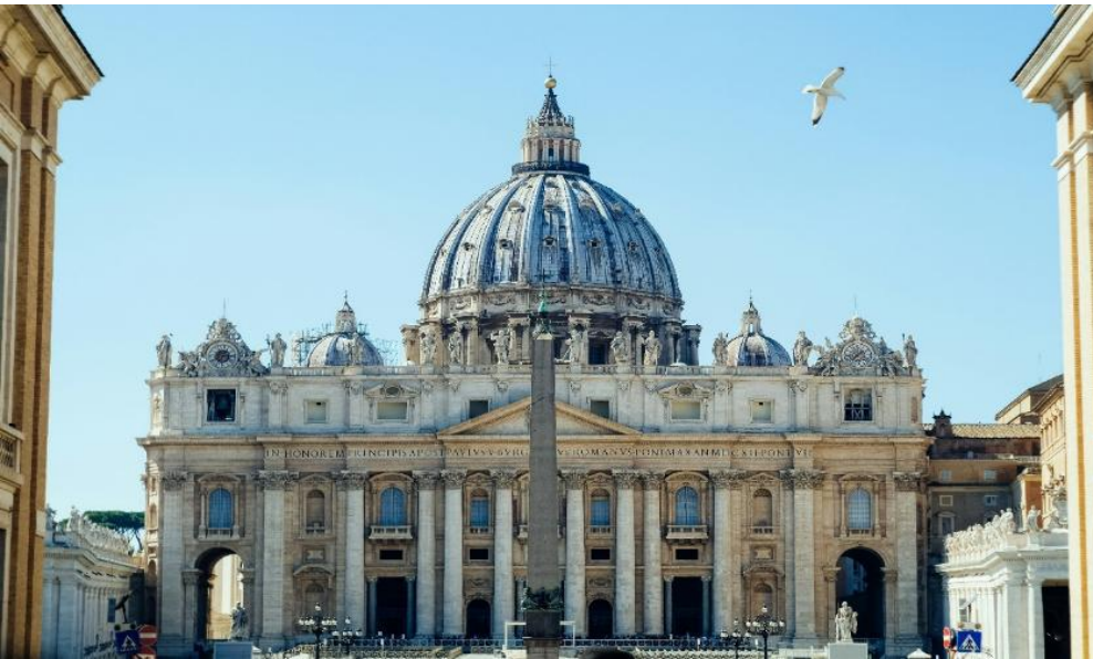
มหาวิหารนักบุญปีเตอร์ ( ST. PETER' BASILICA)

(กรณีมีพิธีด้านใน หรือถ้าหากมีผู้เข้าชมเป็นจำนวนมากจนไม่สามารถเข้าชมได้ทันเวลา ทั้งนี้เพื่อมิให้กระทบต่อกำหนดการท่องเที่ยวอื่นๆ ภายในโปรแกรมทัวร์" อาจจะไม่ได้รับการเข้าชม)