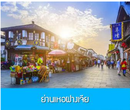
ย่านเหอฝางเจีย

อิสระอาหารมื้อกลางวัน ท่านสามารถเลือกชิม STREET FOOD ขึ้นชื่อมากมายในย่านเหอฝางเจีย