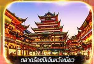
ตลาดร้อยปีเงินหวงเหมียว

เที่ยวดิสนีย์แลนด์เต็มวัน (รวมบัตร + รถรับส่ง)