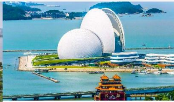
โรงละครไข่มุก