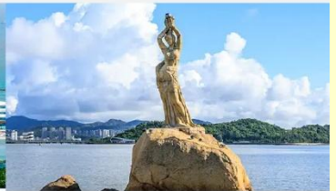
จูไห่ฟิชเชอร์เกิร์ล(หวีหนี่)

*ทางบริษัทฯ ขอสงวนสิทธิ์ในการสลับโปรแกรมทัวร์ตามความเหมาะสมขึ้นอยู่กับสถานการณ์หน้างาน โดยคำนึงถึงผลประโยชน์ของลูกค้าเป็นสำคัญ