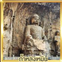
ถ้ำหลงเหมิน