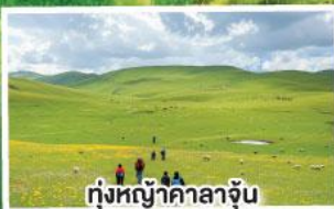
ทุ่งหญ้าคาลาจัน