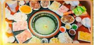
สุกี้เด็ด