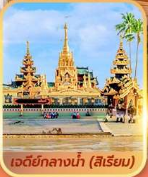
เจดีย์กลางน้ำ (สิเรียม)