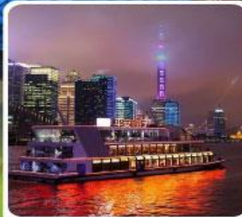
ล่องเรือแม่น้ำหวงผู่