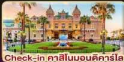
Check-in คาสีโนมอนติคาร์โร