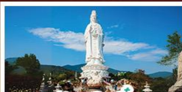
วัดเข็กินอึ้ง