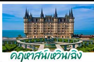
ฤดูหาสมบัติหวิงเจิง

เมืองท่าชิงเต่า - ฤดูหาสมบัติหวิงเจิง เบียร์ชิงเต่า + อาหารทะเล สตรีทอาร์ต สตูดิโอจิบลิ