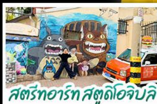
สตรีทอาร์ต สตูดิโอจิบลิ