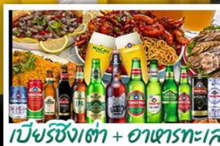
เบียร์ชิงเต่า + อาหารทะเล