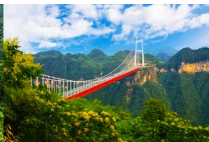
สะพาน ไร่จ้ายต้าเจียว