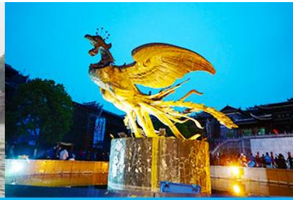
จัตุรัสหงส์