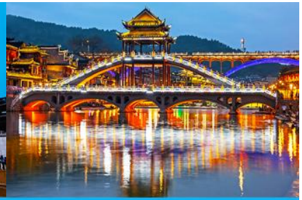
สะพานหงเจียว