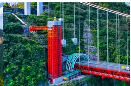
ลิฟท์แก้วอุทยานไร่จ้าย