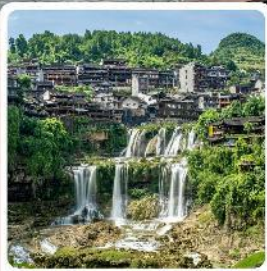
ฟูรงเจิน