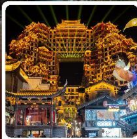
ตึกมหัศจรรย์ 72