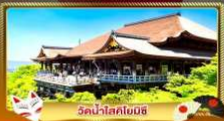
วัดน้ำใสโยมิชิ

ชมงานประดับไฟสุดอลังการ นานาโนะ โนะ ซาโตะ