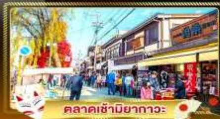
ตลาดซามิยากาวะ