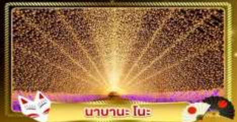
นานาโนะ โนะ