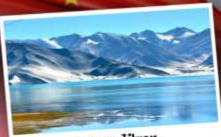
ทะเลสาบไปซาทุ

เปิดประตูสู่อารยธรรมพันปีแห่งซินเจียงใต้ ชมความสวยงามของหมู่บ้านดอกแอปเปิ้ล