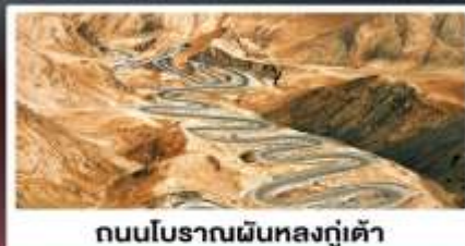
ถนนโบราณผืนหลงกู่เต้า