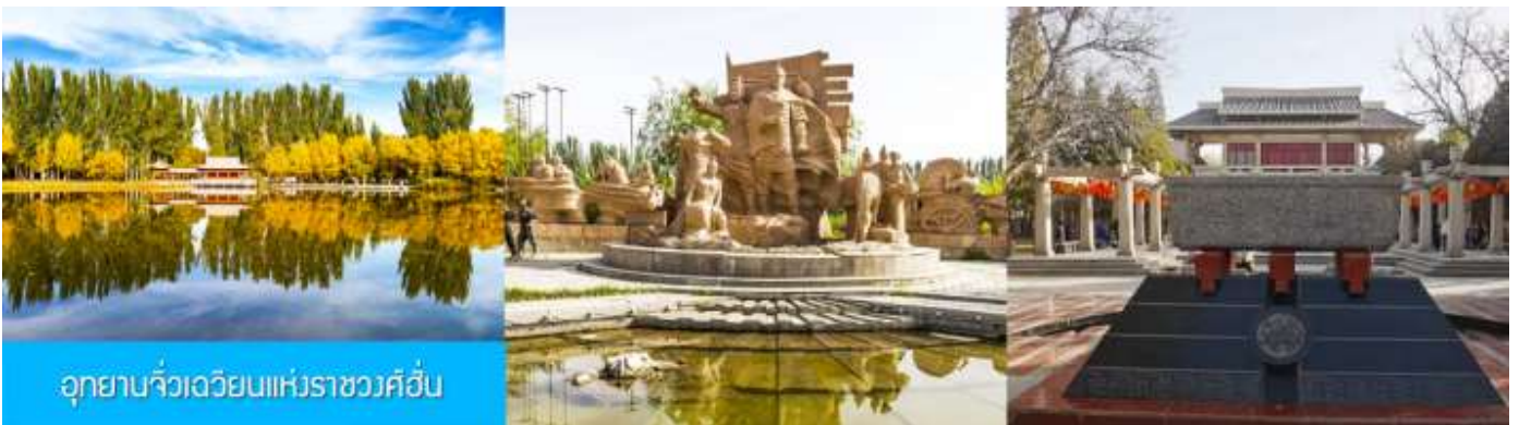
อุทยานจิวเจี๋ยนแห่งราชวงศ์ฮั่น

จากนั้นนำท่านเดินทางสู่เมืองจิวเจี๋ยน (ระยะทาง 50 กม. ใช้เวลาเดินทาง 1 ชั่วโมง)