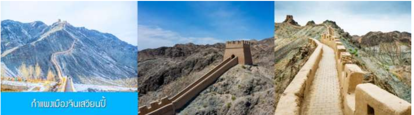
กำแพงเมืองจีนเสวียนปี้