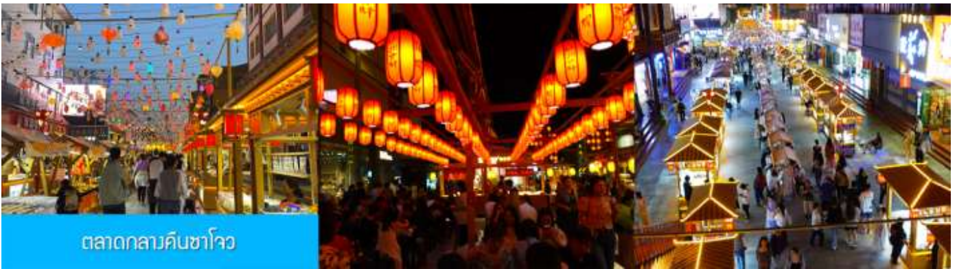
ตลาดกลางคืนซาโจว