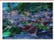
หมู่บ้านแม่วชิเจียง