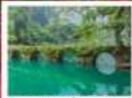
อุทยานเสี่ยวซีโขง