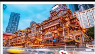
เฉิงเฉิงเฉิง

อุทยานหลุมบ่อฟ้า - อุทยานเขานางฟ้า หงหยาดัง - นังรถไฟทะเลตุ๊ก - อุทยานสีดรุณี ปี้เฉิงโกว - สะพานหนานเฉียว