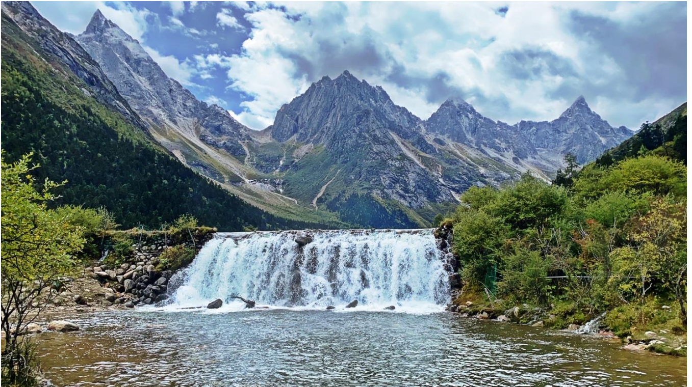
กลางวัน รับประทานอาหารกลางวัน ณ ภัตตาคาร (มื้อที่ 13)