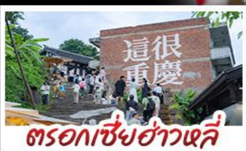
ตรอกเซี่ยฮ่าวหลี่