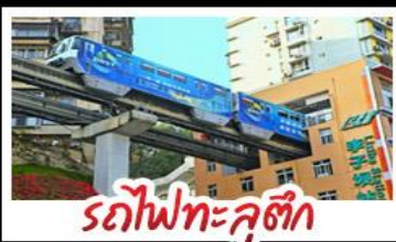
รถไฟทะลุตึก