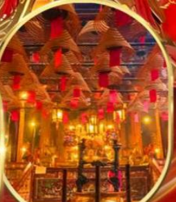
วัดหม่านโหมว