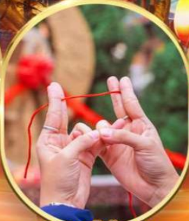
พิธีผูกฟ้เจ้าชายแดง