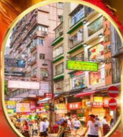
ช้อปปิ้ง ย่านจิมซาจุ่ย