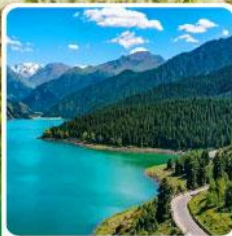
อุทยานเทียนชาน เทียนฉือ