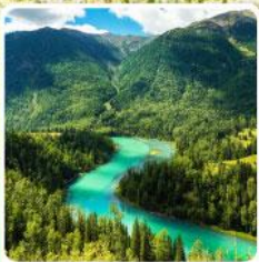
ทะเลสาบคานาสีอ