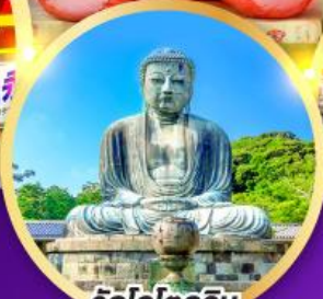
วัดโคโคคุอิน