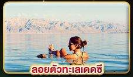
ลอยตัวทะเลเดคซี