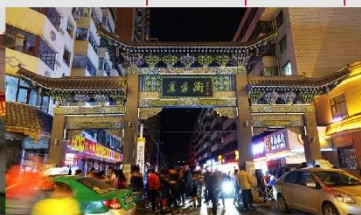
ตลาดกลางคืนถนนม่อเจีย