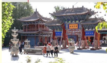
วัดพระใหญ่จางเย่