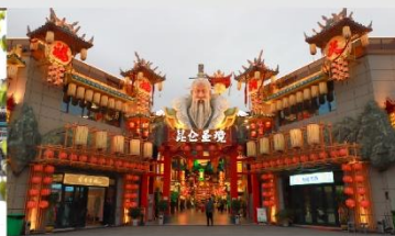
เมืองจำลองวัฒนธรรมคุนหลุน