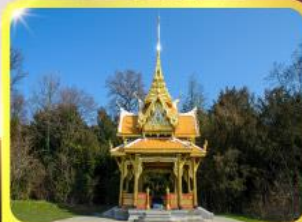
ศาลาไทยไชยานท์