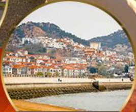
ซาร์จื่อซ่า