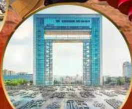
ประตูแห่งความสุข