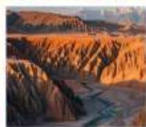
แกรนด์แคนยอนดูซานจื่อ