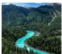
อุทยานคานาสือ