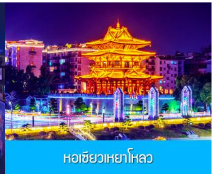
หอชิวเหยาไหล