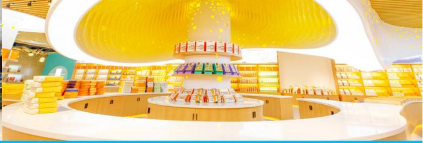
พิพิธภัณฑ์ดอกกุยฮวา

จากนั้นนำท่านเที่ยวชม พิพิธภัณฑ์ดอกกุยฮวา 桂花公社 ดอกกุยฮวาเป็นดอกไม้สีเหลืองที่มีกลิ่นหอม เป็นดอกไม้ประจำเมืองของกุยหลิน จะเบ่งบานในช่วงเดือนมิถุนายน – กรกฎาคมของทุกปี ในช่วงที่ดอกกุยฮวาเบ่งบานในเมืองกุยหลินจะคลุ้งไปด้วยกลิ่นหอมจากดอกกุยฮวา ทั่วเมืองกุยหลินจะเต็มไปด้วยสีเหลืองของดอกกุยฮวา ดอกกุยฮวาสามารถนำมาแปรรูปเป็นอาหารและเครื่องดื่มได้ และได้รับความนิยมจากชาวจีนตอนใต้เป็นอย่างมาก ชมพิพิธภัณฑ์ที่ทันสมัยด้วยระบบจัดแสดงที่ทันสมัย ภายในพิพิธภัณฑ์มีความโอ่อ่า มีการสาธิตและจำหน่ายผลิตภัณฑ์ที่ทำจากดอกกุยฮวา อาทิ ขนมดอกกุยฮวา ชาที่ทำจากดอกกุยฮวา และสินค้าพื้นเมืองอื่น ๆ