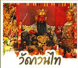
วัดกวนน้้ไท