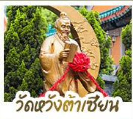
วัดเว้างเต้าเซ้าเซ้า