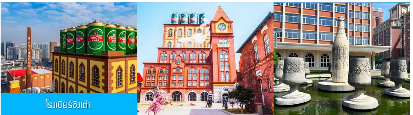
โรงเบียร์ชิงเต่า

รับประทานอาหารกลางวัน ณ ภัตตาคาร *เมนูซีฟู้ด (2)