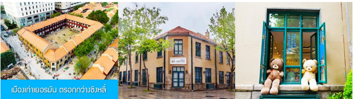
เมืองเก่าเยอรมัน ตรอกกว้างชิงหลี่

จากนั้นนำท่านเดินเที่ยวชม ถนนจงซาน 中山路 ถนนที่เต็มไปด้วยกลิ่นอายยุโรป และถนนสายนี้มีบันทึกเรื่องราวมากกว่าศตวรรษของเมืองชิงเต่าไว้ ที่นี่เป็นศูนย์กลางการค้าแห่งแรกที่เต็มไปด้วยสถาปัตยกรรมสไตล์ยุโรปเก่าแก่ที่ได้รับอิทธิพลมาจากเยอรมัน ให้ท่านได้เดินเก็บบรรยากาศ และ เก็บภาพกับ โบสถ์เซนต์ไมเคิล (ด้านนอก) โบสถ์แห่งนี้ที่คู่รักนิยมมาถ่ายภาพงานแต่งงานแต่งงานกันมากที่สุดในเมืองชิงเต่า ให้ท่านถ่ายรูปเก็บภาพ