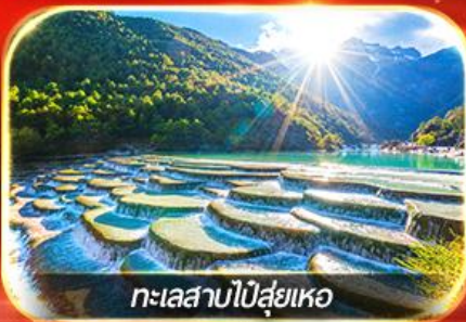
ทะเลสาบโป๋ซู่เหอ