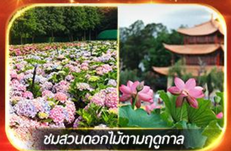
ชมสวนดอกไม้ตามฤดูกาล

นั่งกระเช้าสู่ภูเขาหิมะมังกรหยก ชมโชว์ทิเบต "Impression Lijiang" สุดอลัง เชคอินคาเฟ่วิวภูเขาหิมะ, ชมดอกไม้ตามฤดูกาล