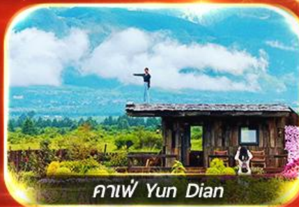
กาแฟ Yun Dian