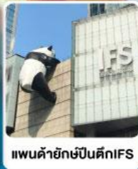
แพนด้ายักษ์ปีนตึกIFS