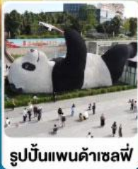
รูปปั้นแพนด้าเซลฟี