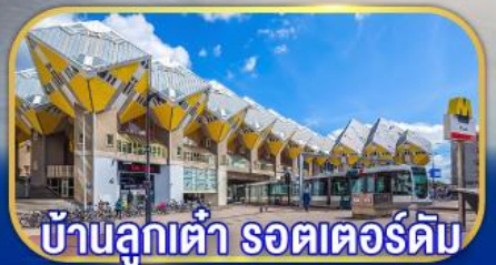
บ้านลูกเต่า รถเตอร์ดัม

เยือนเมืองเก่าแก่ยุโรปที่ เก็บไฮไลต์กลุ่มประเทศเบลลักซ์ กับการบินไทย บินตรงอัมสเตอร์ดัม