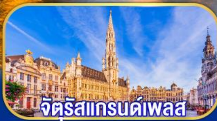
จัตุรัสแกรนด์เพลส