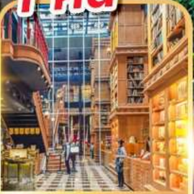
ร้านไอศกรีมมियाฮาร่า