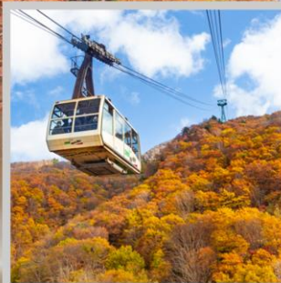
“ZAO CHUO ROPEWAY”