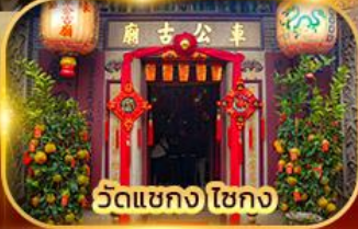
วัดเขกง ไชกง