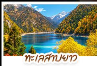
ทะเลสาบขาว