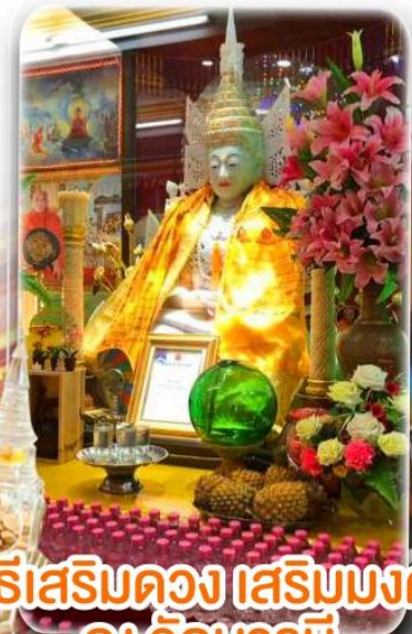
พิธีเสริมดวง เสริมมงคล ณ วัดบารมี

ได้เวลาอันสมควร ตามเวลานัดหมาย นำท่านเดินทางสู่ สนามบินเพื่อทำการเช็คอินเอกสารแก่ท่าน