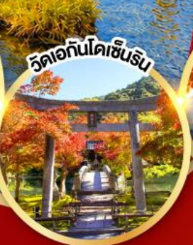
วัดเอกันโตเซ็นริน