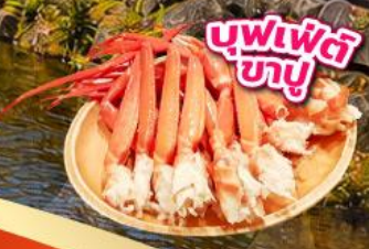
บุฟเฟ่ต์ ปลาย

รวมไฮไลท์จุดชมใบไม้เปลี่ยนสี เที่ยวโตชิซุโอะกะฟูจิ